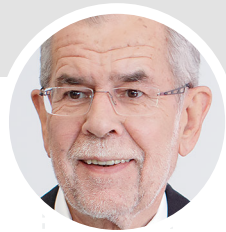
VAN DER BELLEN

AUSWERTUNG: SUBSTANTIVE MIT MINDESTENS 4 ZEICHEN*