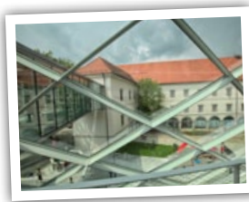
Schlossmuseum Linz