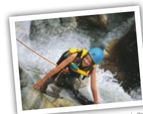
Symbolfoto © Österreich Werbung / Fankhauser

Jugendgästehaus Bad Ischl: Tel.: +43 6132 / 26577, E-Mail: jgh.badischl@oejhv.or.at