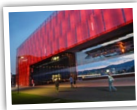
Lentos Kunstmuseum