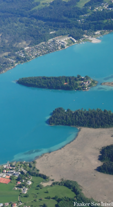
Faaker See Insel