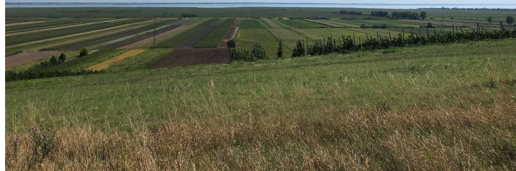
Blick nach Osten zum Neusiedler See