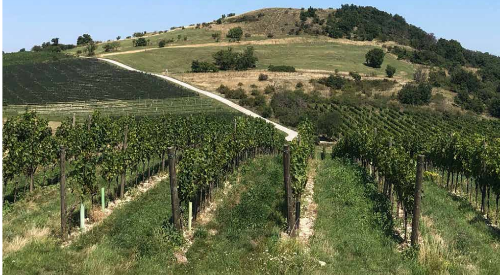
Blick nach Nordost zum Naturschutzgebiet Hackelsberg