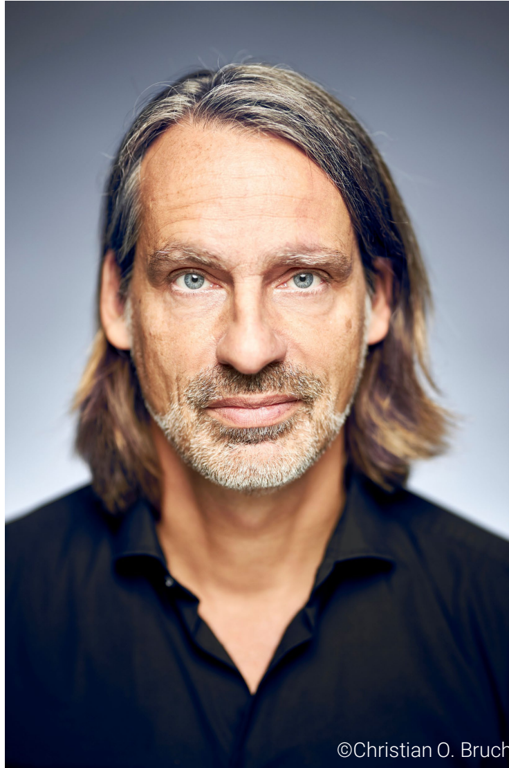
Richard David Precht Philosoph, Bestsellerautor, Publizist